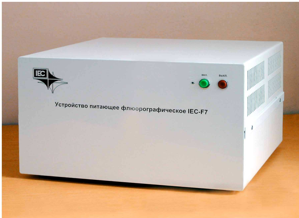
Рис. 2.1.1 Блок управления IEC-F7. Внешний вид

Управление всеми электрическими и электромеханическими блоками и узлами УРП IEC-F7 осуществляется с помощью блока управления, внешний вид которого показан на рис. 2.1.1.