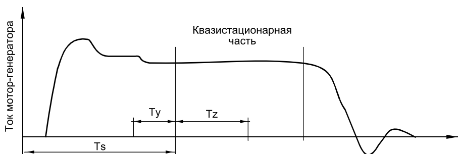
Рис. 1. Временные характеристики работы диагностирующего и контролирующего оборудования.

Для питания магнитной системы торсатрона «Ураган-2М» существует специальный энергокорпус, где с помощью мотор-генераторов ударного типа создаётся мощный импульс тока. Ток в обмотках магнитной системы установки может достигать 50 кА. Длительность фазы нарастания и спада магнитного поля составляет несколько секунд. Квазистационарная часть импульса магнитного поля достигает 4..6 секунд (рис. 1.) Именно на этой стадии импульса проводятся физические эксперименты по удержанию, нагреву и исследованию плазмы.