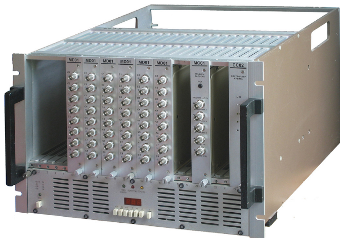
Рис. 2. Крейт интерфейса КАМАК с модулями системы синхронизации

Модуль MC01 предназначен для логической обработки сигналов запуска и блокировок, а также генерации сигнала управления таймерами системы синхронизации, который выведен на резервную линию магистрали крейта P1 (или P2). Модуль запуска MC01 содержит два программируемых таймера и схему запуска системы синхронизации. Модуль позволяет выполнять пуск системы от внешнего сигнала, с помощью кнопки, расположенной на модуле, или по команде, поступившей с компьютера, при условии отсутствия каких-либо аппаратных или программных блокировок. Один из таймеров модуля (канал А) разрешает работу остальных таймеров системы синхронизации и обеспечивает их одновременный запуск, а второй (канал 0) — может использоваться для формирования сигнала управления, задержанного относительно момента запуска на время до 100 секунд. Оба таймера позволяют программировать временные задержки с точностью до 1 мкс.